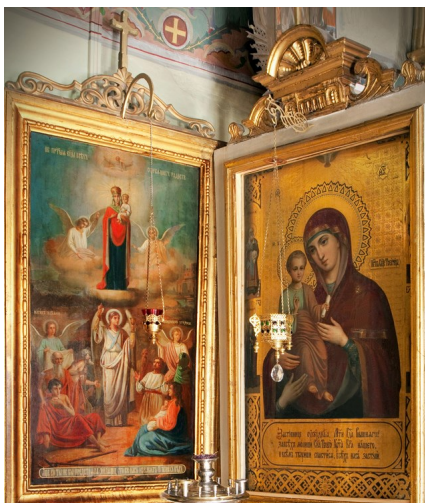
Медальница Пресвятой Богородицы и Иерусалимская икона Божьей Матери

30.11.2019 17:16 - Обновлено 07.12.2019 18:42