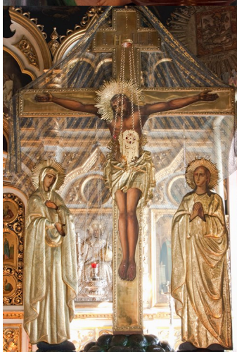
Воскресение Иерусалимской иконы Божьей Матери «Окаянная послушница»